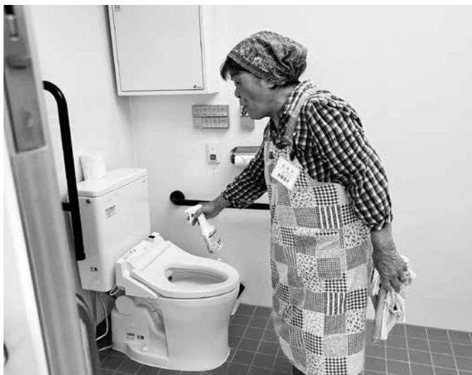
御主人日く掃除の丁寧さでは誰にも負けません

く利用できるように丁寧な作業を心がけています。 趣味 主人と一緒にゴルフをすることが好きです。年に2回、前職場のOBコンペに参加し目標を持って楽しく続けています。また、自宅には保護猫を3匹飼っており、仲良く楽しく生活しています。 これからやりたいこと センターの仕事を通じて、良い汗をかき、日々感謝しながら、主人と2人で末永く活動を続けたいと思っています。