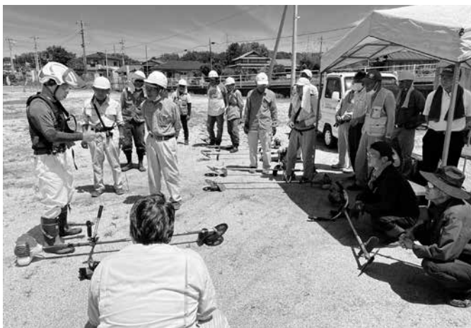
刈払機の使い方についての実習