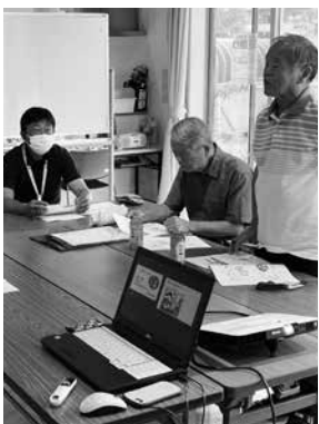
木山下辻団地福祉座談会