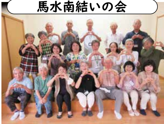
場所／馬水南公民館／日時／毎月第3土曜日 10時