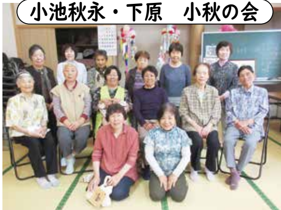
場所／小池秋永公民館／日時／毎月第22日 13時30分