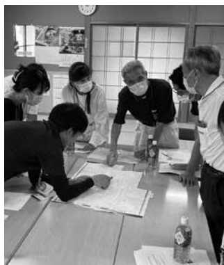
惣領4町内福祉座談会