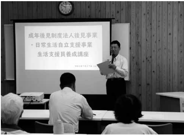
講座開催について趣旨や目的を説明しています

講座後の質問では「支援員は自分の車で利用者宅に行くのですか」「両方の事業で医療行為の同意、身元保証人が支援できないことになっているがなぜか」等あり、アンケートでも支援員としてすぐ活動できる方もいて、今後の活動の幅を広げていければと考えています。