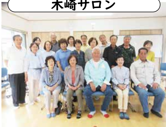
場所／木崎公民館／日時／毎月第3金曜日 10時