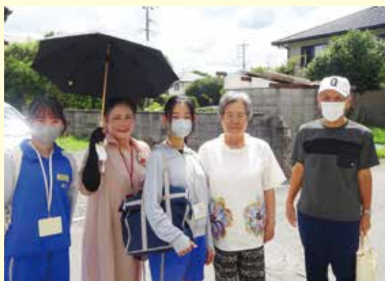
地域と子どもたちをつなぐ民生委員活動