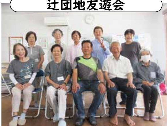
場所／辻団地集会所／日時／毎月第3水曜日 9時30分